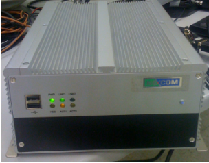
Ejemplo de equipo industrial tipo MSU